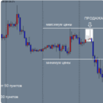
Стратегия forex для валютной пары EUR/JPY