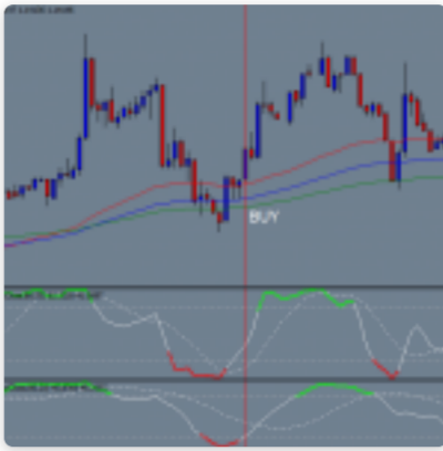
Скальпинг на M1. Стратегия торговли «Триколор».