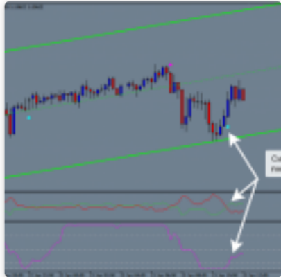
Стратегия для 15-минутного графика SHI FX