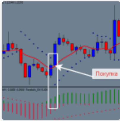
Надежная стратегия форекс Press Mod